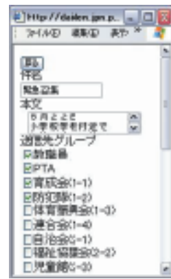
■携帯電話での送信画面