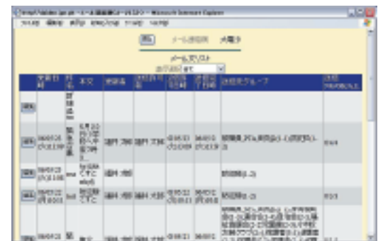
■パソコンからのメール送信一覧画面